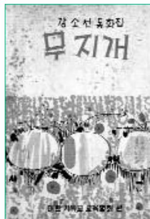
[Arc-en-ciel], Recueil de contes de So-chun Kang, association coréenne des chrétiens, 1965

Won-soo Lee (1911 ~ 1981). L'univers de cet écrivain polyvalent – auteur, poète et critique littéraire – reflète la vie des enfants qui vivent non pas dans un monde imaginaire, mais dans la réalité. Il se caractérise par son regard critique sur la société, sans pour autant être pessimiste : les personnages de ses œuvres n'échappent pas à la dureté de l'existence, à travers la guerre, la pauvreté et