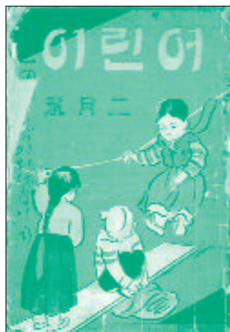
Revue Eorini [Enfant], février 1933